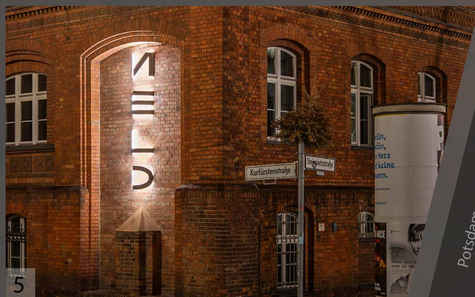
Blick von der Seite

Die Beleuchtung ist dimmbar und wird über einen Lichtsensor geschaltet. Für die Sonderanfertigung wurden LED-Bänder für den Ausseneinsatz in klarem Verguss verwendet. Vandalismus, Graffiti- und Taubenschutz wurde bei der Planung berücksichtigt.