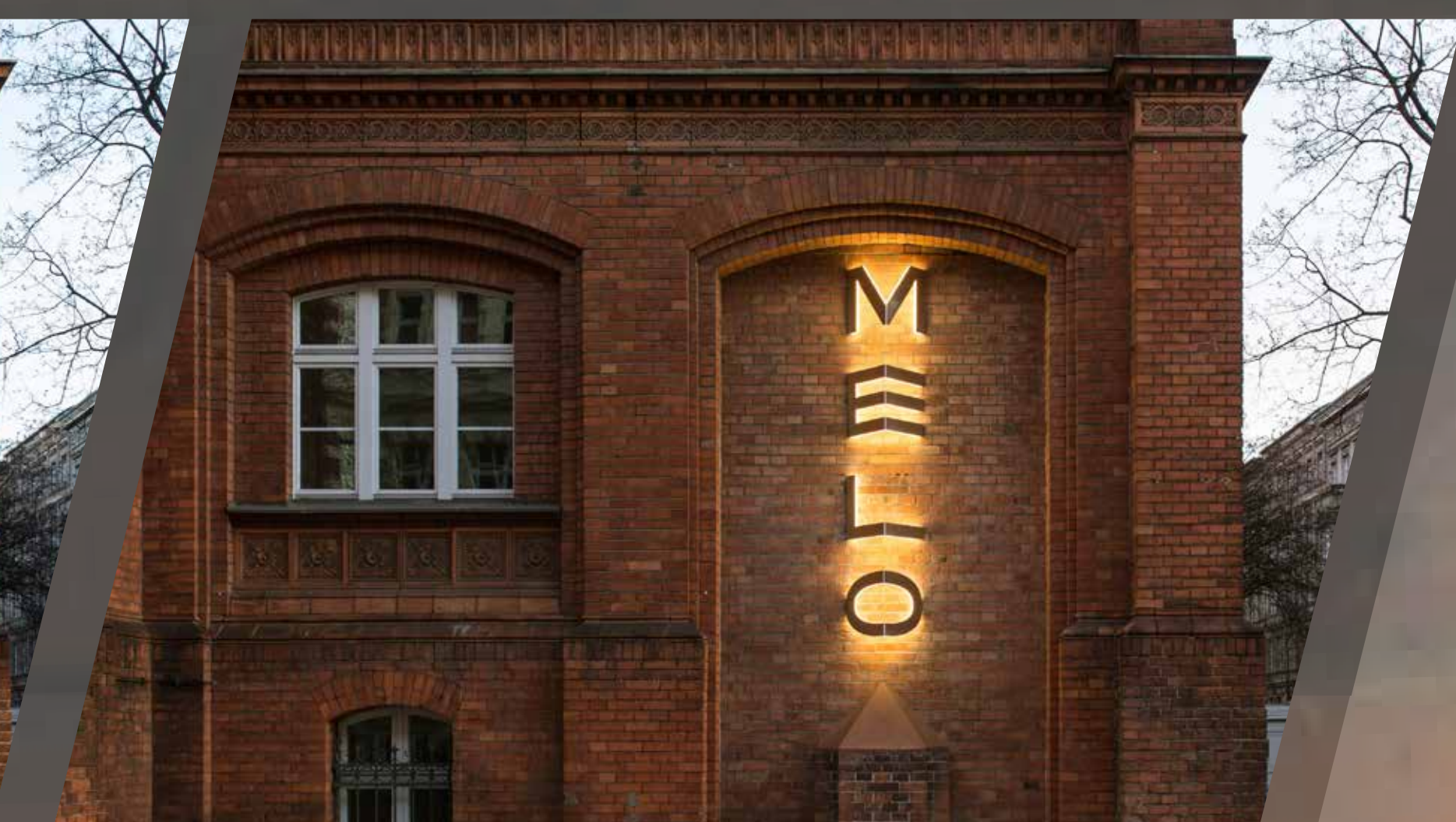
hinterleuchtetes Logo am Abend

Hasenheide 9 Hof 2 / Aufgang 1 10967 Berlin