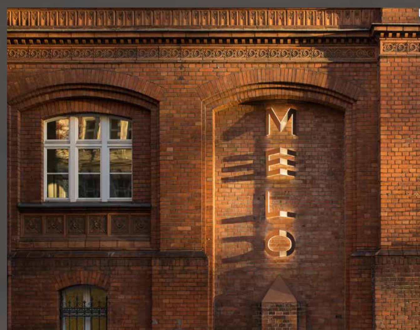
die Installation am Tag