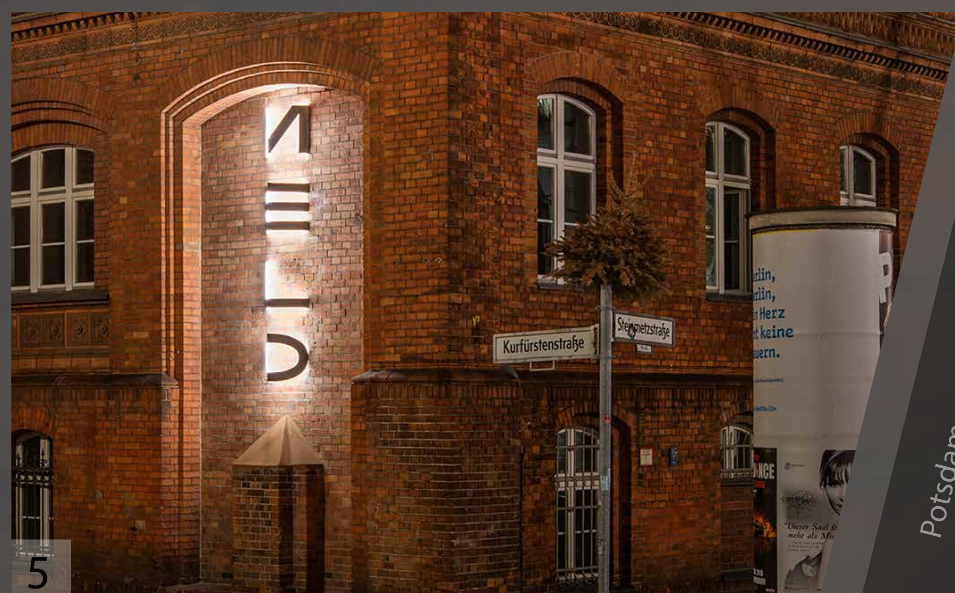
Blick von der Seite

Die Beleuchtung ist dimmbar und wird über einen Lichtsensor geschaltet. Für die Sonderanfertigung wurden LED-Bänder für den Ausseneinsatz in klarem Verguss verwendet. Vandalismus, Graffiti- und Taubenschutz wurde bei der Planung berücksichtigt.