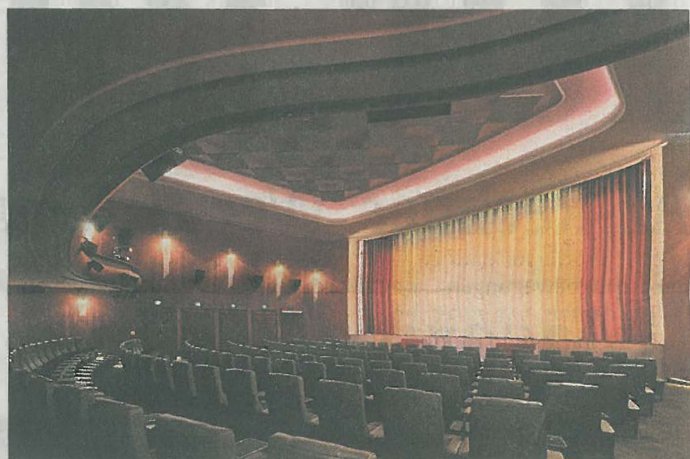
Der Gloria Palast, nicht umsonst ein „Lichtspielhaus“.