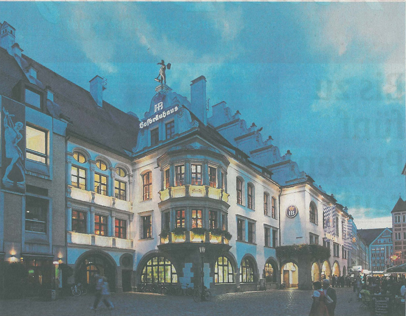
Münchner Original: Das Hofbräuhaus erstrahlt in LED. Heute um 18.30 Uhr kann man die Beleuchtung aus der Nähe betrachten.